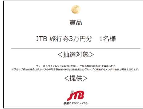
図 2 賞品