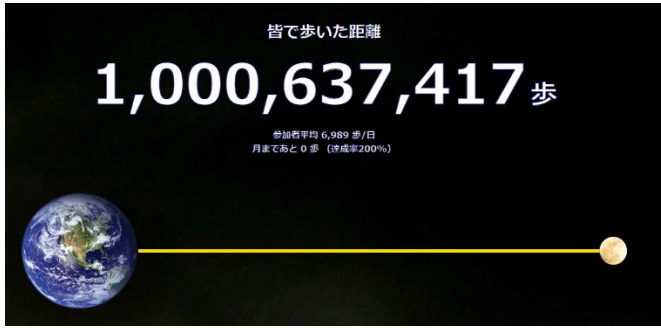
図 1 最終歩数