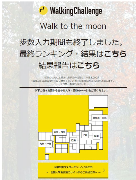
図 3 公式 HP トップ画面