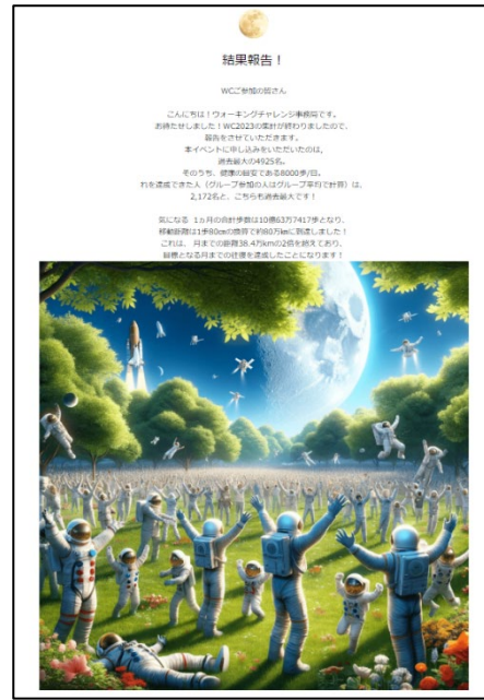
図 4 HP 結果報告案内